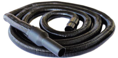
10,5 m veniv voolik